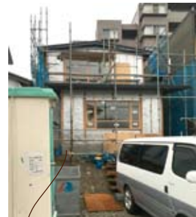
2018年3月23日 建設中の様子写真